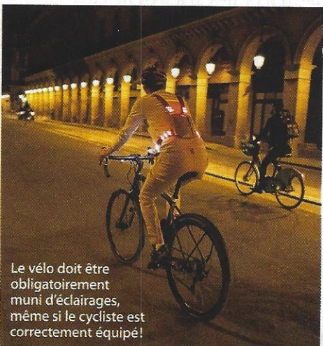
Le vélo doit être obligatoirement muni d'éclairages, même si le cycliste est correctement équipé!

En avril 2016, l'article R313-25 a été modifié et précise que « Deux feux ou dispositifs de même signification et susceptibles d'être employés en même temps ne peuvent être à intensité variable, sauf ceux des indicateurs de direction, des feux de position arrière, des feux stop, des feux de brouillard arrière et du signal de détresse ». On pourrait penser que désormais, en référence aux feux de position, qu'il soit possible de mettre un feu à intensité variable à l'arrière de son vélo... ce que certains pourraient comprendre par un feu clignotant. Mais l'article parle de véhicule possédant « deux feux », alors que réglementairement sur un vélo, il n'y en a qu'un. Le sens des termes « intensité variable » est aussi flou car cela peut correspondre à la visibilité émise par le feu et non pas le caractère alternatif. Pour éviter de se mettre en porte-à-faux et de risquer une contravention, nous vous conseillons de conserver un feu fixe à l'arrière. En cas d'infraction pour un de ces cas, la contravention sera de 1 re classe.